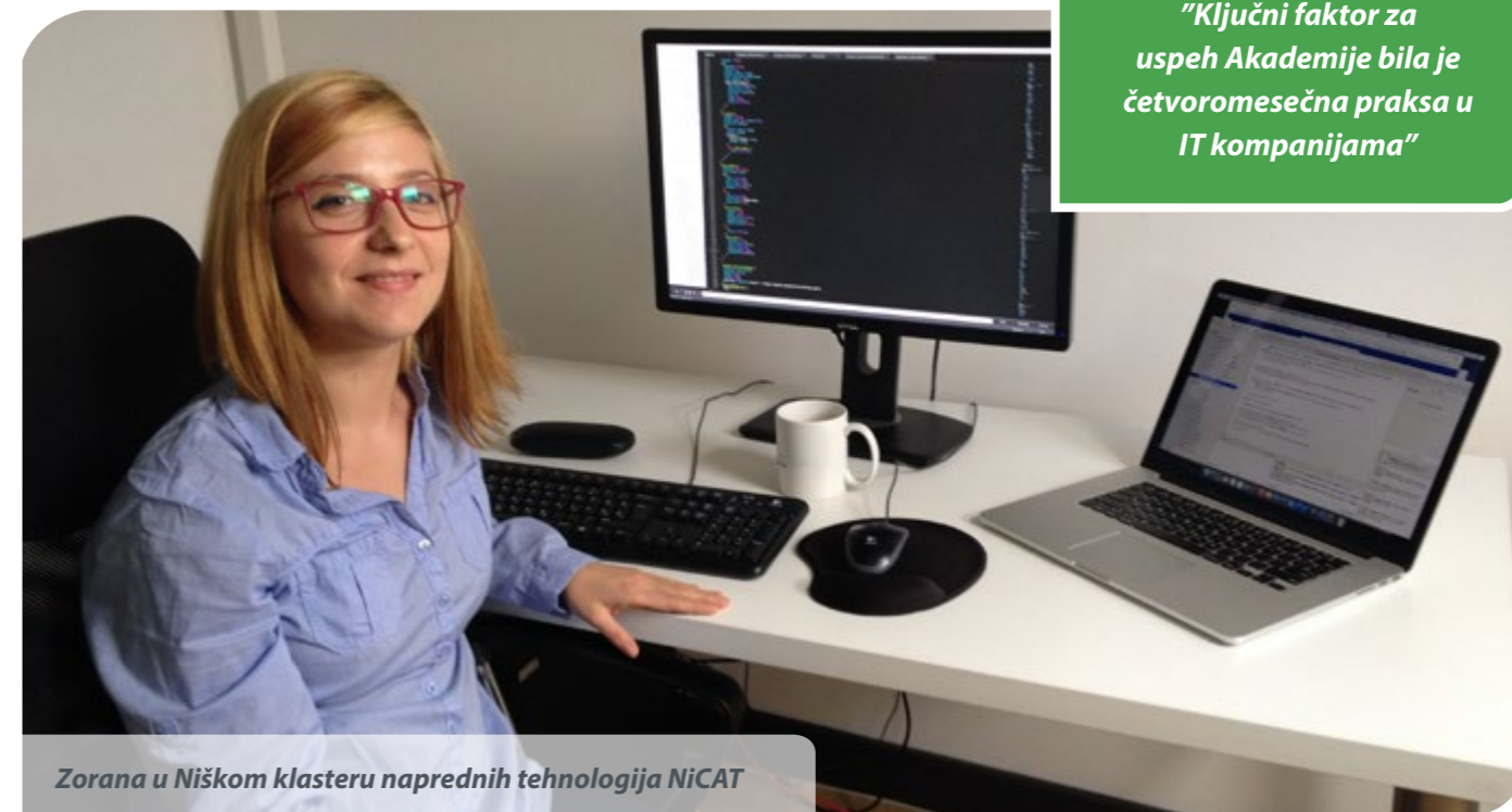
Zorana u Niškom klasteru naprednih tehnologija NiCAT