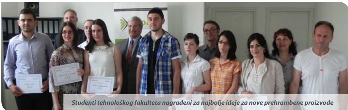
Studenti tehnološkog fakulteta nagrađeni za najbolje ideje za nove prehrambene proizvode

Prerađivači hrane, članovi Parka, su kreirali zajednički brend pod nazivom „Top Food”, u okviru kog se na tržište plasira 19 proizvoda namenjenih prvenstveno kupcima iz zemalja bivše Jugoslavije. Glavni cilj Parka je da smanji troškove proizvodnje, poveća prodaju u regionu i razvije i uvede nove proizvode primenom tehnoloških inovacija.